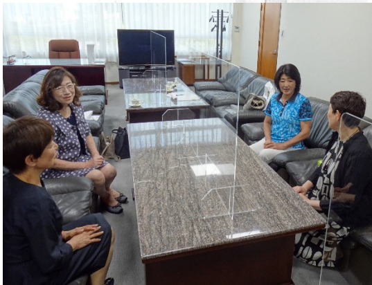
コロナ禍の中での活動について話し合う正副会長＝境港商工会議所