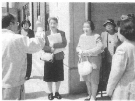
2002年 市リサイクルセンターを視察