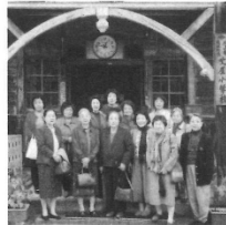
2003年 レクリエーションで吹屋ふるさと村(岡山県)へ