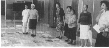
2000年 環境ごみ問題作品コンクール審査会

1969年5月に創立した境港商工会議所女性会の半世紀の足取りを振り返るこのシリーズ。4回目の今回は、2000年から2009年までの10年間の様子を懐かしのスナップショットで紹介いたします。