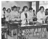
2007年 県商女性 会連流会=境 港商工会 議所