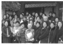
2006年 堺商工会議所女性会と交流