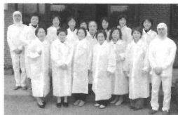
2008年 大山ハム(株)の工場を視察