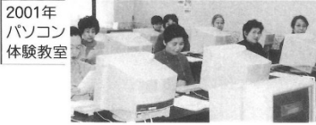
2001年 パソコン 体験教室