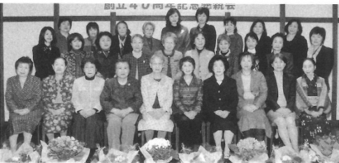
2009年 創立40周年記念懇親会