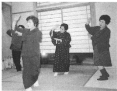
2004年 新年互例会で鬼太郎音頭