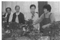
2005年 寄せ植え講習会