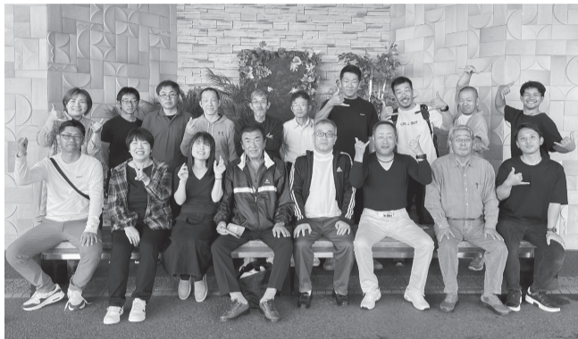
社員旅行を楽しむ皆さん=昨年10月、福島県のリゾート施設

さらに、有給休暇推奨日を設定することで休暇を取りやすい工夫も行っており、昨年の有給休暇取得率は74%に達しました。また、管理