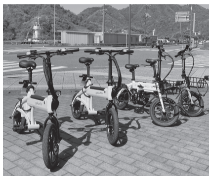
境港市観光案内所前のレンタサイクル

タリング(散歩のように緩やかに走る)の「おすすめとして、いくつかのサイクルコースを紹介しています。同観光協会の担当者は「水木しげるロードはもとより、これまであまり紹介されてこなかった場所などをのんびりと電動サイクルや電動アシストサイクルで巡り、境港の新たな魅力を感じてもらい、自分なりの映えスポットで写真を撮影するなど、