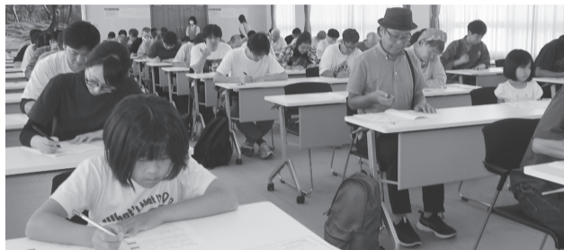
問題に取り組み受験者 昨年の境港会場

境港商工会議所と(一社)境港観光協会は「第19回 境港妖怪検定」の実施日をことし10月4日に決定しました。受験申し込み期間は、8月15日から31日までです。会場は、これまで通り境港会場が境港商工会議所(上道町)で、調布会場は調布市市民プラザあくるす(東京都調布市)となります。