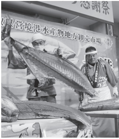
割裁人による迫力満点のマグロ解体ショー

境港天然本マグロPR推進協議会は「境港まぐろ感謝祭」を6月14日に境漁港(境港水産物地方卸売市場2号上屋周辺)で開催します。