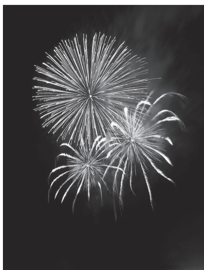
夜空に輝く大輪の花火

お越しください」と話しました。詳しくは、みなと祭実行委員会(事務局Ⅱ(一社)境港観光協会、☎47-3880)にお問い合わせください。