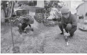
ていねいに草取りします

○一言PR!…草取り・草刈り作業を夫婦で丁寧に対応します。「きれいになって助かった」と喜んでいただけるよう、一件一件に心を込めて作業します。見積りは無料です。小さな困りごとでも気軽にご相談ください。