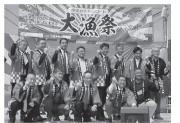
開会式に出席した皆さん