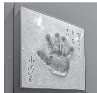
卒寿記念「水木しげるの手形」

水木の卒寿(満90歳)を記念して作られたブロンズ製の手形を1階エントランス壁画横に展示しています。入