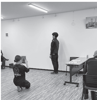
姿勢チェックを実施