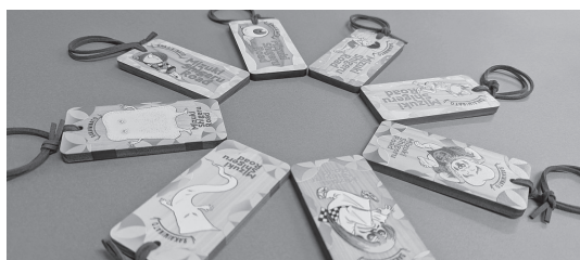
好評販売中のラゲッジタグ ©水木プロ

類はこれまで合計1000個以上を売り上げています。タテが9センチ、ヨコは4センチの大きさで、ヒノキ製。革製のひも付きです。