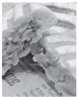
姫甘えびの海鮮まん焼き