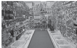
店内には多彩なルアーがずらり

○一言PR…当店は、幅広い品揃えの量販店とは対角の「厳選した品のみをより解りやすく」をモットーに、人気ルアーから珍しいルアーまで品揃えをしています。どんな疑問にも店主が答えますので、気軽にお声掛けください。また、不要になったルアー用品の買い取りも行っています。見積もりは無料です。皆さんのご来店をお待ちしています。