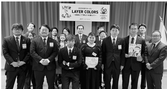
2025年度ありがとうございました！2026年度もよろしくお願いいたします＝境港青年会議所一同