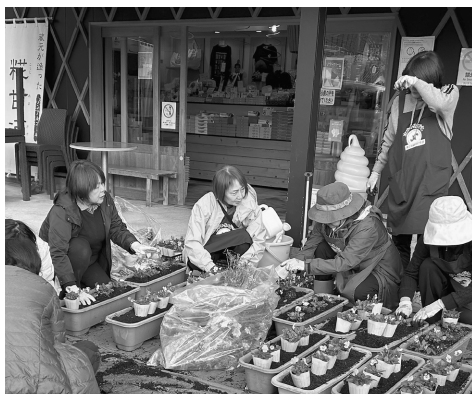
参加メンバーが 植え替え作業を行う女性会メンバー

当女性会が年2回、春と秋に行っている恒例事業・水木しげるロードのプランター花の植え替えを昨年11月19日に行いました。 朝まで降っていた雨も上がり、清々しい天気の中、作業を開始。まずは、