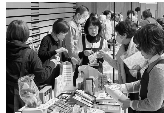
会員提供の品物で人気集中したバザー

「盲導犬を引く手の力が弱くなり、ひとりで杖を頼りの外出の中、『信号が青になりましたよ』の一言が嬉しいですね」と、自身