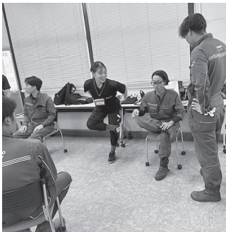
ストレッチの指導