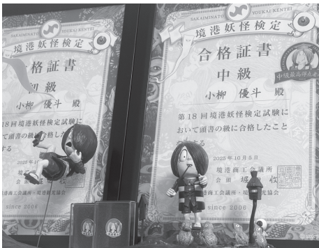
検定勉強の合間に作ったプラモデルたちと。息抜き時間も、妖怪がいきました ©水木プロ

知れません。そして、忘れはしない10月5日。手ごたえはあった！しかし、初級・中級両方とも100点満点でパスできたこと、知った時には、我が事ながら仰天。