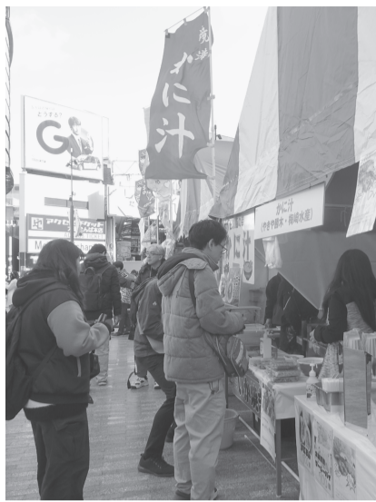
鳥取県の味覚を来場者にアピール