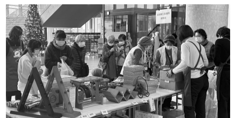
出店商品を買求めるフェス参加者の皆さん

人権ふれあいフェスティバル「バザー」出店で参加 収益は社会福祉や地域貢献へ 境港商工会議所女性会は、昨年12月16日に境港市民交流センター・みなとテラス(上道町)で行われた「境港市人権ふれあいフェスティバル」にバザーで出店参加しました。