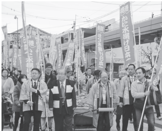
カニを山積みにしたリヤカーを先頭に水木しげるロードをパレードする皆さん=2020年1月19日

毎年恒例のカニ感謝祭が1月14日、カニ水揚げ日本一PR実行委員会(越河彰統会長)の主催で行われます。今回は、4年ぶりのパレードも実施。 ことしで21回目を迎えるこのイベントは、午前10時から水木しげる記念館前(本町)で実施。まず、大漁太鼓の演奏でスタートし、セレモニーを行った後、パレードします。 同パレードは、一般参加者と地元関係者や人力