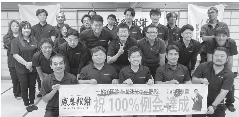
2023年度ありがとうございました！2024年度もよろしくお願いいたします