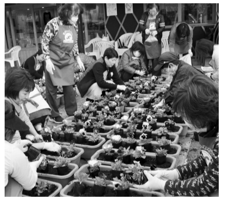
植え替え作業中の参加メンバー

まずは、会員が手分けして同ロードの各店舗からプランターを回収し、じげの物産館広場に50台のプランターを並べ、春に植えたベゴニアなどを抜き取るところから作業がスタート。