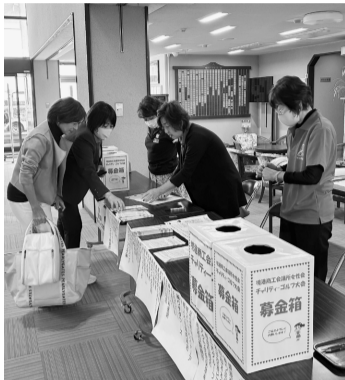
募金に協力する参加者