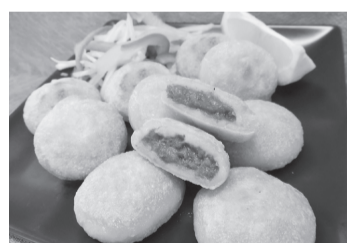
「アジの包み焼き」の味は2種類

ことし5月に行われた「第8回みんな選ぶ境港の水産加工大賞」の受賞商品、(株)大新の「とれとれあじ」。境港で水揚げされた新鮮なアジのたたき身です。その「とれとれあじ」に、県内産の白ねぎ、にんじん、しいたけを加えて生地で包んだ「アジの包み焼き」は、「いわしワンタン」に続く、境港総合技術高校の生徒との