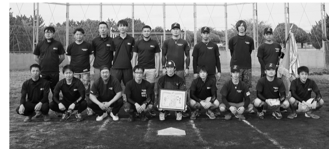
優勝した境港海陸運送チーム=航空自衛隊美保基地グラウンド

同大会はA、Bの2グループで計3ブロックに分かれて予選リーグを行い、ブロックごとの勝者3チームを決定。この