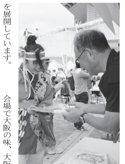
境港市も積極的に観光PRを実施

同イベントは、青少年の健全育成と大阪の活性化を目的とした大阪ミナミ活性化事業として「OSAKAキッズダンスマイルフェスティバル」を2012年に開催したことから始まりました。2015年には、道頓堀開削400年記念として開催した「道頓堀リバーフェスティバル」と同フェスティバルが合体。2000人余りの大阪府民・市民が日ごろの練習の成果を発表し、楽しむ秋祭りとして定着しています。