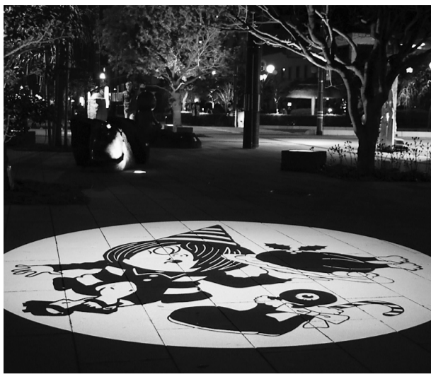
クリスマスバージョンに登場した鬼太郎ら=昨年の夜間演出照明

1916(大正5)年に創立され、わが国の照明技術の発展や照明知識の普及に大きく貢献してきた(一社)照明学会の