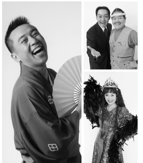
境みなと寄席に出演する皆さん

子ども達を守るのには、大人の責任です。皆さんからの情報提供が助けを求めている子ども達の発見や保護につながります。児童虐待をいち早く発見し、被害にあっている子どもを保護するために▽子どもが毎日激しく泣いている▽夜一人で留守番をさせられている▽毎日汚れた同じ服を着ている▽など、「虐待かも」と思える子どもを発見したときは、最寄りの児童相談所や警察、市町村などに通報してください。児童相談所全国共通ダイヤル189番にかけると、近くの児童相談所につながります。児童虐待とは、保護者が子どもに対し次のような行為を行うことです。 ●身体的虐待 殴る・蹴る、熱湯をかける、たばこの火を押しつける、強く揺さぶることなど ●性的虐待 わいせつな行為をする、またはさせる、児童ポルノの被写体にするなど ●ネグレクト 乳幼児を車中に放置する、適切な食事を与えない、乳幼児や児童を家に残したまま 度々外出する、学校に行かせない。また、保護者以外の同居人が身体的虐待や性的虐待、心理的虐待などの行為をすることを放置することなど ●心理的虐待 児童の前で家族などに暴力を振るう、言葉による脅し、他の兄弟姉妹に比べ、著しく差別的な扱いをする、児童を無視したり拒否するような態度を示す、児童の心を傷つけるような言動をすることなど 詳しくは、境港警察署(☎44-0110)へ。