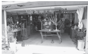
セレクトした雑貨が並ぶ店舗

○一言PR!…体をいたわるとともに、自身の時間をゆっくりと過ごしに来てください。