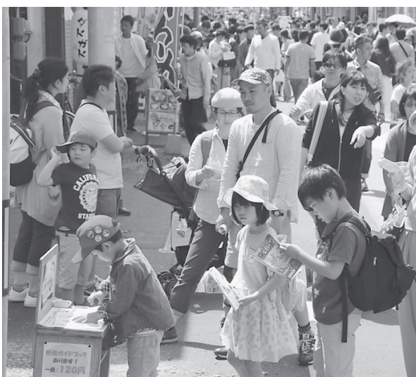
大人気の妖怪スタンプラリーには行列も

詳しくは、同協議会事務局（松江商工会議所内）0852-3210504にお問い合わせください。