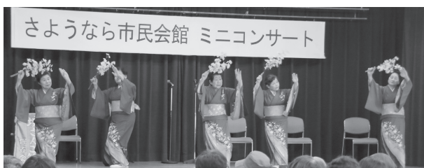
境さんご節を披露する保存会の皆さん（市民会館大会議室で）

境港市民会館は、境港市民交流センター（仮称）建設のため、4月30日に閉館しました。1973