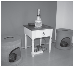
「よもぎ蒸し」の黄土椅子

○創業のきっかけ?…義父の看病をしていた当時、大変な時だからこそ自分の時間を作ろうと思い、看病しながらできることがないか考えていました。そんな時、「よもぎ蒸し」が目に入り、自分で情報を集めているうちにますますハマっていきました。また、以前から雑貨も好きだったため、これらを仕事にしようと2014(平成26)年にオープンしました。