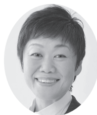
講師の山本洋子大使

(FISH) 大使を講師に迎え、「境港の宝をリアル宝にー情報発信と価値づけで売り上げUP」誰に、何を、どう伝える?」をテーマに講演会を開催します。