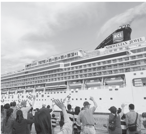
4月22日に寄港したノルウェー・ジャン・ジョイ号を見送る皆さん

が複数回寄港し、乗船客も欧米人が中心でした。6月以降は大型客船も増え、日本人を含めたアジア系のお客様が多くなると見られます。特に6月11日に寄港す