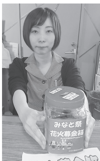
約110カ所に設置した募金箱

花火募金にご協力を みなと祭のフィナーレに 大輪の花火を打ち上げよう 今年のみなと祭は、7月21日（土）に前夜祭として