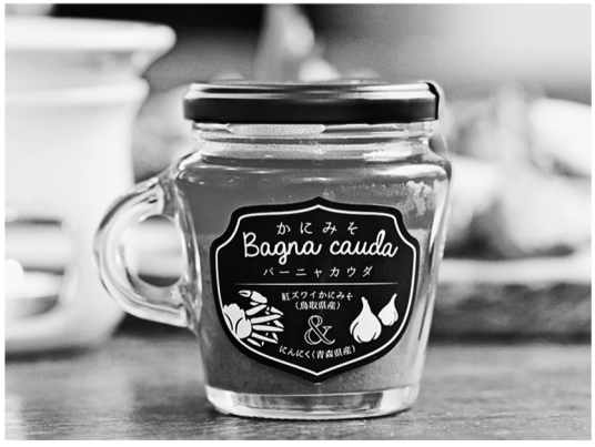
新商品「かにみそバーニャカウダ」好評発売中！！