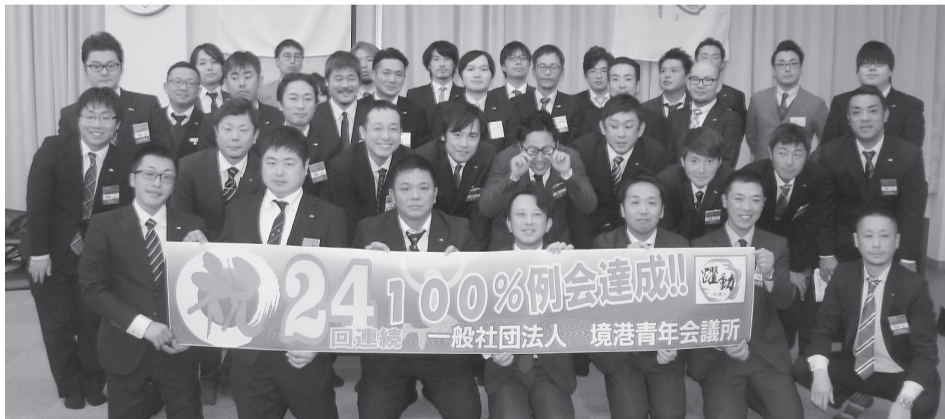
2017年度ありがとうございました! 2018年度もよろしくお願いいたします。(境港JC一同)