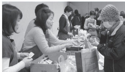
次々と売れていく当会会員が提供した商品

会員が持ち寄った日用品や贈答品など、超破格のお値打ち品ばかりを提供する女性会のバザーは大人気。開始前から品定めをするお客様もあり、