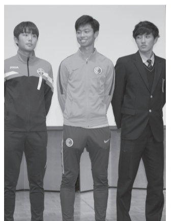
3チームの選手代表があいさつ

ら3日間、第1回アジア国際ユースサッカーIN鳥取を開催。日本を含む3地域の18歳以下で構成されるチームがチュウブY A J I N スタジアム(米子市安倍)で熱戦を繰り広げました。