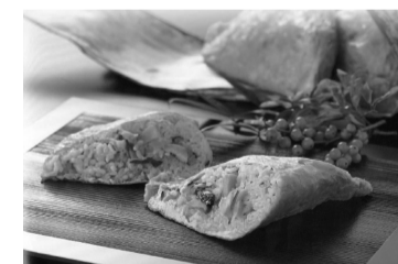
「いただき」の別名もある「ののこめし」

近年、年1回は学校給食で提供され、児童や生徒に大人気の一品となっています。真心こめた手作りの地元の味を、ぜひ一度ご賞味ください。詳しくは、同社(☎42-6620)へ。