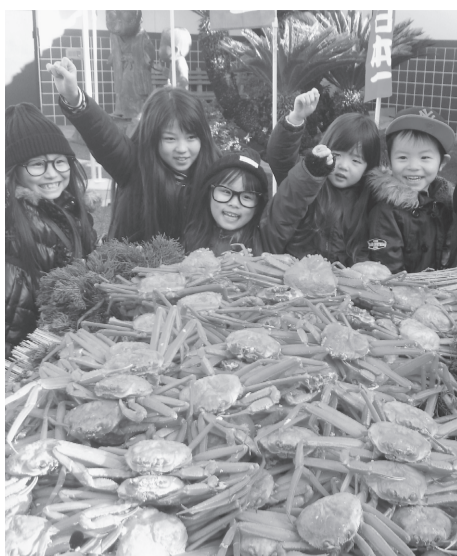
カニ満載のリヤカーと子どもたち

カニ水揚げ日本一を誇る境港市。「マグロ感謝祭」「水産まつり」と並び、境港の水産3大祭りの一つである「カニ感謝祭」が1月21日に開催されます。 15回目となる境港の真冬の祭り・カニ感謝祭は、海の恵みに感謝の気持ち