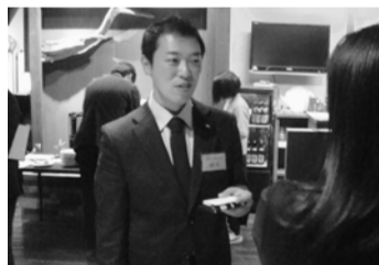
名刺を交換する当JCメンバー(左)

境港青年会議所は4月21日、「次世代交流会」を「みなとコラボ」を Asian Resort Dining 炯 (竹内団地) で開催。