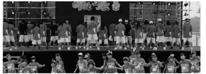
最終地点でパフォーマンスをする踊りパレードの参加チーム

お祭り広場北側の道路では今年のお目玉、ちびっこ遊園地を開催。午後からのステージでは、地元の高校生のダンスチームや山陰で活躍するバンドの若い力で盛り上げます。