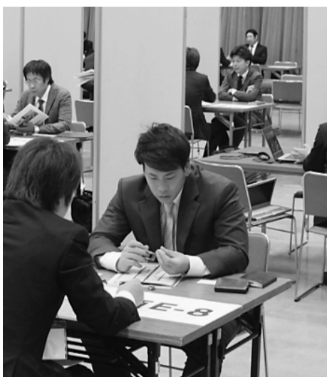
熱心に商談する企業関係者ら(昨年の会場=くにびきメッセ)