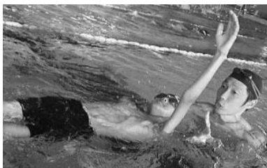
コーチの指導で楽しく上達

1期 日時 7月24日(月)・25日(火)・27日(木)・28日(金) (4日間、7月26日(水)は休館日のため休み) いずれ