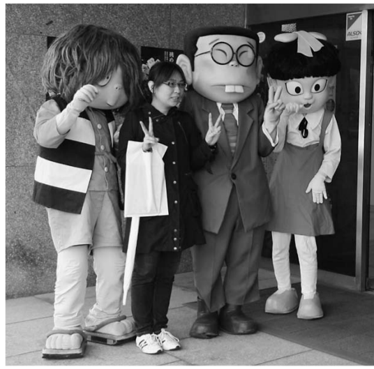
試験終了後に鬼太郎らとリラックスする受験者 (境港商工会議所玄関前で)

故・水木しげる先生の妖怪考察を通じて、妖怪の理解度を高めるもの。毎年1回開催しており、今回で12回目の開催となります。受験申込の受付開