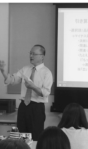
新商品の販売促進などの役割担う人材の育成に努めた職業訓練

採用方法などについて、詳しくは同機構鳥取支部コンソーシアム事業担当(☎0857-5218804)にお問い合わせください。