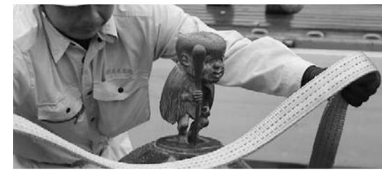
移設のトップバッターとなったこなき爺 ©水木プロ

本格着工に向けた安全祈願祭が5月7日に行われた水木しげるロードの大規模リニューアル。6月7日には、いよいよ妖怪ブロンズ像の移設が始まりました。