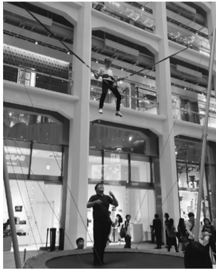
ちびっこ遊園地「イケイケ!! びんらん」の目玉アトラクション

7月23日に行われる「みなと祭」も、今年で72回目を迎えます。当青年会議所が主管するお祭り広場内外で実施するイ