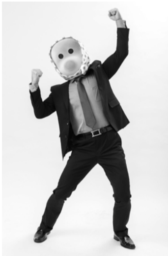
テレビCMで注目を集める「どじよまん監督」もイベントに登場

大漁市場なかうらは、家族で楽しく交流してもらおうと、7月9日・16日に「夏祭りだヨ！全員集合」を開催します。当日は、お子さんに人気の「ロケットくれよん」のライブや、「ご当地ヒーローと一緒に遊ぶコーナー」など、イベントが盛りだくさん。テレビCMで注目を集める「どじよまん監督」も登場します。同イベントのあらましは、次の通りです。