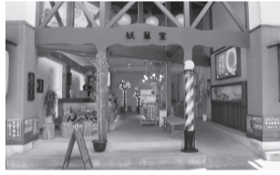
開放的な店舗外観