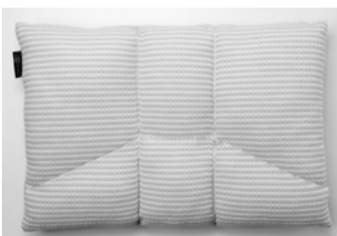
オーダーメイド枕で快眠を

「00年祭」について、詳しくは同実行委員会事務局(鳥取県西部総合事務所大山振興室内・☎31-9371)にお問い合わせください。