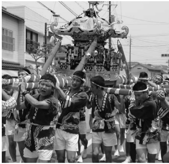
水木しげるロードを練り歩くみこしパレード

本祭は、大港神社のご祭神・事代主神(恵比寿様)に海上安全・大漁豊漁を祈願する「大漁祈願」へと続きます。