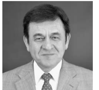
講師のケント・ギルバート氏

日時 7月14日(金) 午後6時開演 会場 夢みなとタワー(境港市竹内団地) 定員 200人(先着順、定員になり次第締切) 申込方法 ハガキに