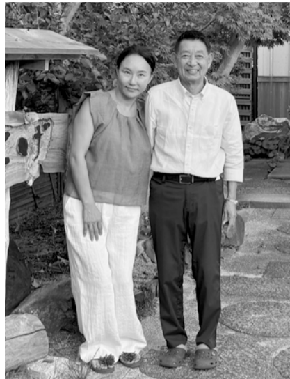
二人三脚でお客様をもてなす澁山夫妻

コロナウイルス感染症が収束しつつあるなか、インバウンドや国内旅行も以前のような活気が戻ってきており、旅行業界にも賑わいが出てきました。国内外のお客様をお迎