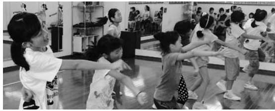
練習に励む生徒たち(ダンススタジオFLAPSで)