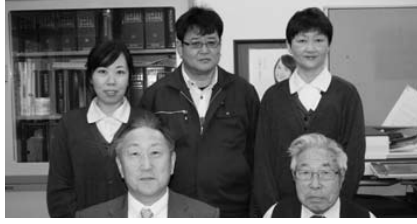
様々な分野に対処する川田事務所の皆さん

小学校6年生を対象にした「将来就きたい職業アンケート」で、男子の1位はスポーツ選手、2位は警察官であるという。女子はケーキ屋、芸能人(タレント・歌手)が1・2位とのこと。税理士や司法書士などの士業は影も形もない。存在自体を知らないのだ。